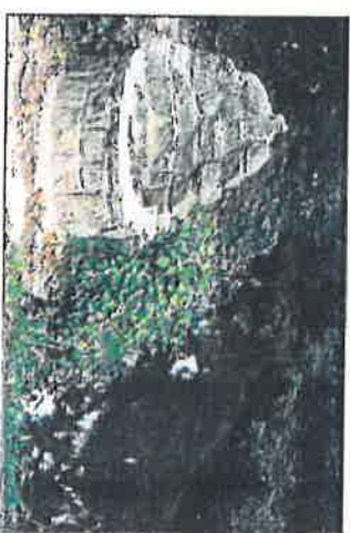
Fontaine Sainte-Justine

port routier commença à se faire sentir, surtout pour les voyageurs, avec l'apparition des premiers autocars, plus rapides et plus confortables.