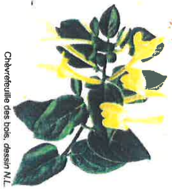
Chevreuil des bois, dessin N.L.

traversés de la D 27 entre 2 et 3 puis 2 et 3