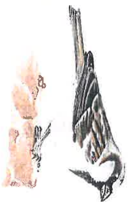
Moineau domestique, dessin P.R.

Cet itinéraire présente les mêmes qualités que le précédent. Ils peuvent se coupler pour réaliser une agréable balade de 12 km.