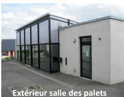
Extérieur salle des palets