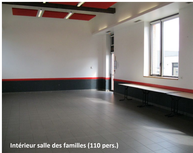
Intérieur salle des familles (110 pers.)