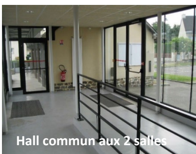
Hall commun aux 2 salles