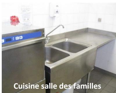
Cuisine salle des familles