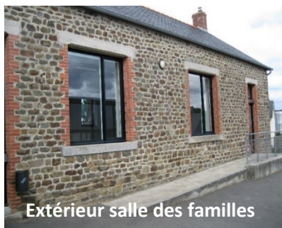
Extérieur salle des familles