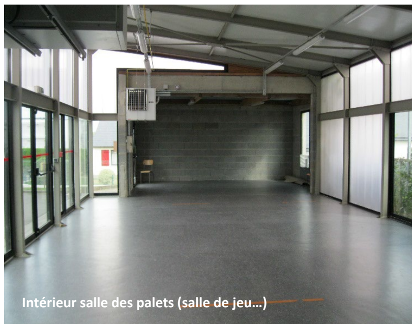
Intérieur salle des palets (salle de jeu...)